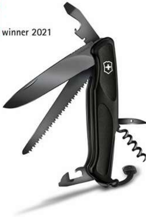
Victorinox Ranger 55 Grip Onyx Black in schwarz – 0.9563.C31P