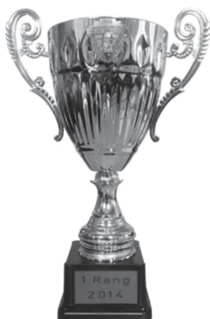
Grosser Rothenthurmer Becher 300m