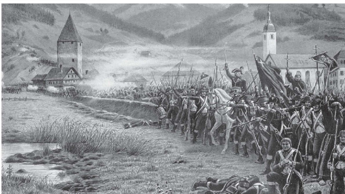
Gefecht zwischen den Schweizern und Franzosen am 2. Mai 1798 am Rothenthurm